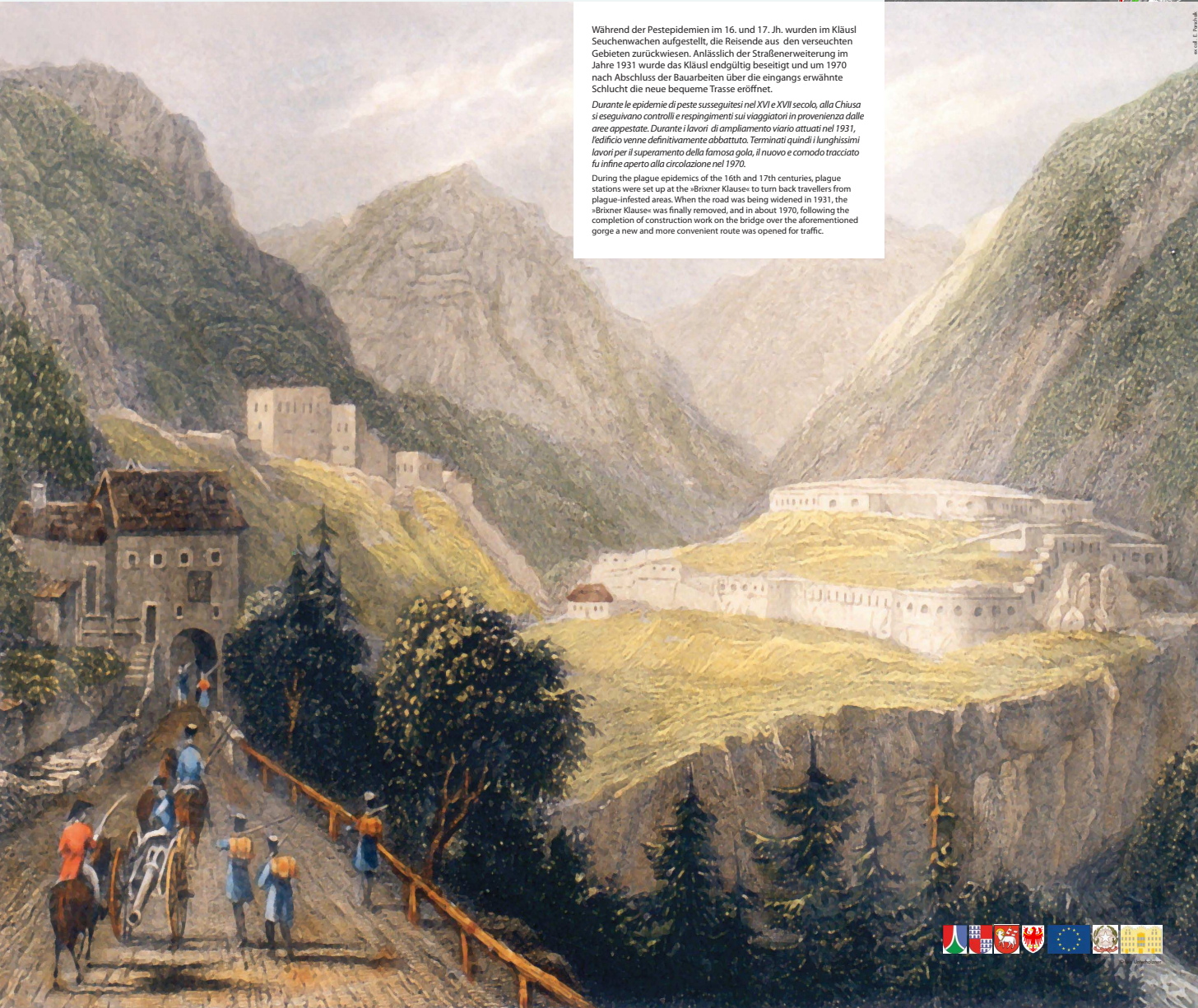
Während der Pestepidemien im 16. und 17. Jh. wurden im Kläusl Seuchenwachen aufgestellt, die Reisende aus den verseuchten Gebieten zurückwies. Anlässlich der Straßenerweiterung im Jahre 1931 wurde das Kläusl endgültig beseitigt und um 1970 nach Abschluss der Bauarbeiten über die eingangs erwähnte Schlucht die neue bequeme Trasse eröffnet.