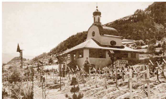
Im Jahr 1917 war der Soldatenfriedhof bereits von Kreuzen übersät. Nel 1917 il cimitero militare era già coperto di croci. By 1917, the soldiers' cemetery was already covered with crosses.

The soldiers' cemetery of Brixen/Bressanone and Vahrn/Varna was inaugurated in 1915, and in the following year the chapel (small picture) was sanctified by Prince-Bishop Franz Egger.