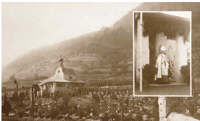
1915 wurde der Soldatenfriedhof Brixen/Vahrn eingeweiht. Ein Jahr später weihte Fürstbischof Franz Egger die Kapelle ein (kleines Bild). Il cimitero militare venne inaugurato nel 1915. Un anno dopo il principe vescovo Franz Egger benedisse la cappella (foto piccola).

The soldiers' cemetery of Brixen/Bressanone and Vahrn/Varna was inaugurated in 1915, and in the following year the chapel (small picture) was sanctified by Prince-Bishop Franz Egger.