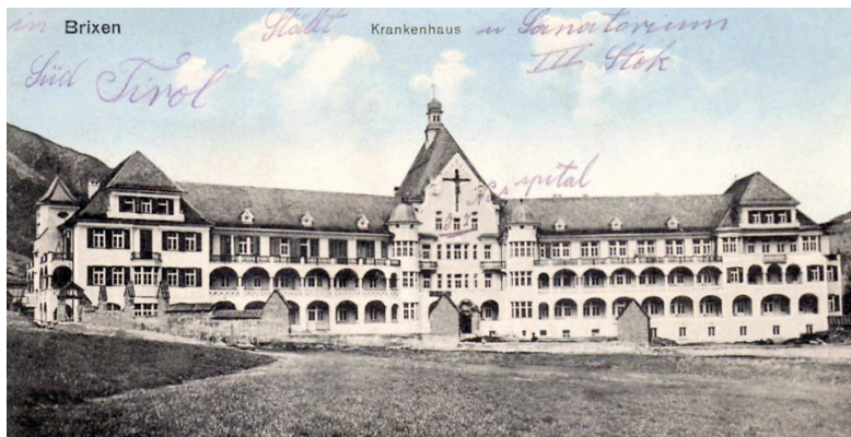
Das neue Krankenhaus kurz vor seiner Fertigstellung. L'ospedale nuovo poco prima del completamento dei lavori. The new hospital shortly before its completion.